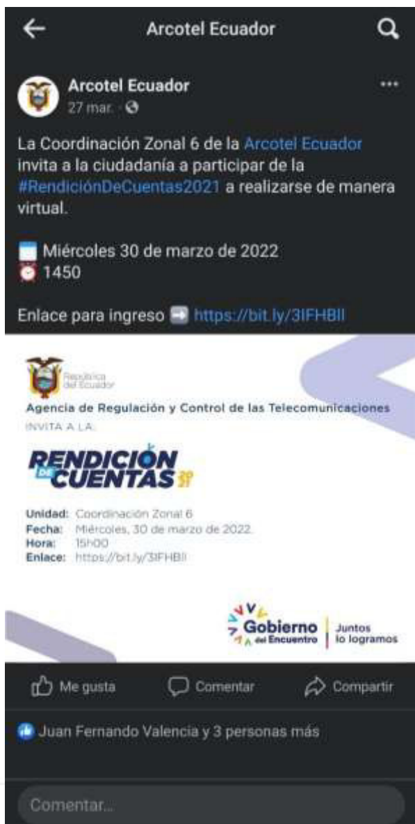
Capturas de pantalla de la deliberación pública