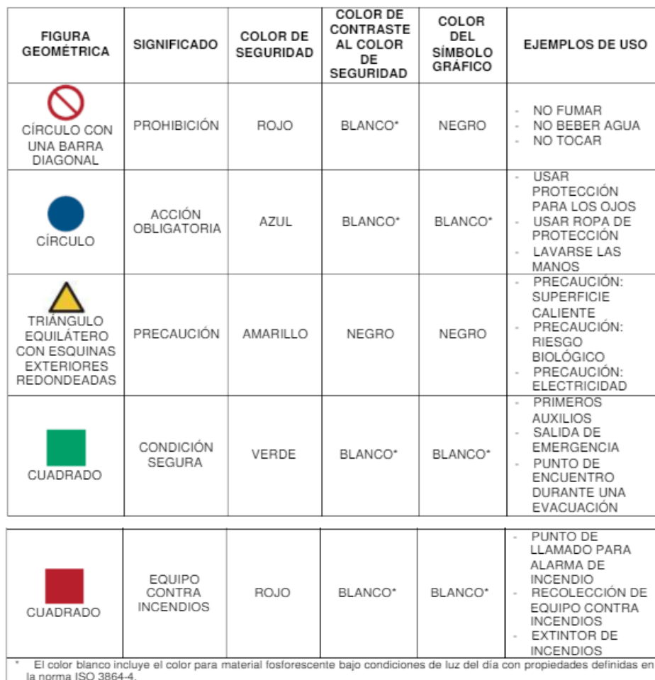
TABLA 2 – Figura geométrica, colores de fondo y colores de contraste para señales complementarias